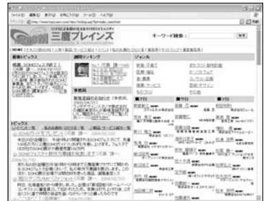
●ガイドと連動している「三鷹ブレインズ」 http://www.topicserv.com/mbs/

担当もビックリ! 〜大幅増量の三鷹SOHOガイド ロコミ・ネットワークを構築。 (4)「起業のきっかけ」欄を新設し、SOHOの「人」の面にさらにスポットを当てた。 (5)「SOHO便利帳」を追加、さらに使いやすい構成になっています。