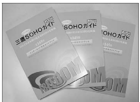
●2004年版三鷹とその周辺のSOHOガイド(¥1,050 税込)

「こんなSOHOもあったのか」「読み物としても面白い」と好評の三鷹SOHOガイド。2004年版はさらにバージョンアップして登場。さて、どこが変わったかといいますと: (1) 昨年の80件から大幅増、145件のSOHOを掲載。 (2) NPOとSOHOの「地域における協働」に目を向けた特集記事。 (3) 「紹介者」を明記して、より信頼できる