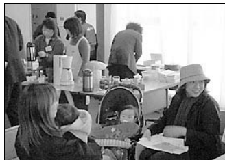
●みたかモール「アフロ茶屋」

の講演ならもう一度聞いてもよいくらい」(SOHO事業者)などの評価が返ってきた。お忙しい中、三鷹まで足を運んでくださったお二人の講師に心からの感謝を捧げた。