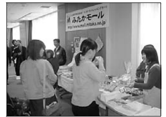
●みたかモール販売コーナー

ト」の4つの会場に区分けし、午後1時から5時までの短い時間に、盛りだくさんのイベントが行われることとなった。 さらに3階「情報の森」