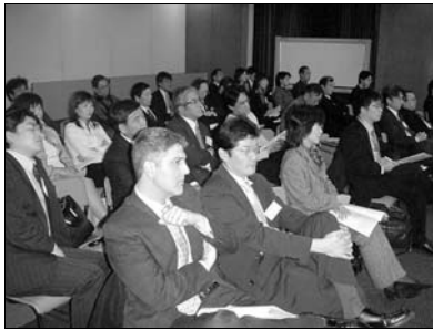
●ビジネスプランコンテスト発表会場

所(一) (東京都世田谷 のおしゃれ研究 た「おばあちゃま うプランを発表し して「おばあちゃん で、どんな外出 プを提供すること 洋服のラインナップ しかもおしゃれな の変化に対応し、 ど加齢に伴う体形 丸いおばあちゃんのため の洋服(特許出願中)な